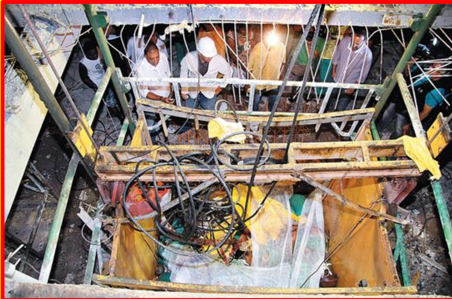
CORPOS DOS NOVE OPERÁRIOS MORTOS SÃO OBSERVADOS POR COLEGAS

Nos primeiros minutos de trabalho, às 7h05, o destino dos nove operários culminou no pior acidente da construção civil baiana. Em fração de segundos caiu do 28º andar do prédio em construção o elevador. Testemunhas contaram que os gritos dos operários, durante a queda, foi desesperador.