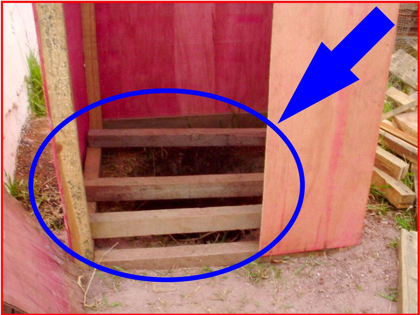
SANITÁRIO EM USO – 19 E 20/09/02