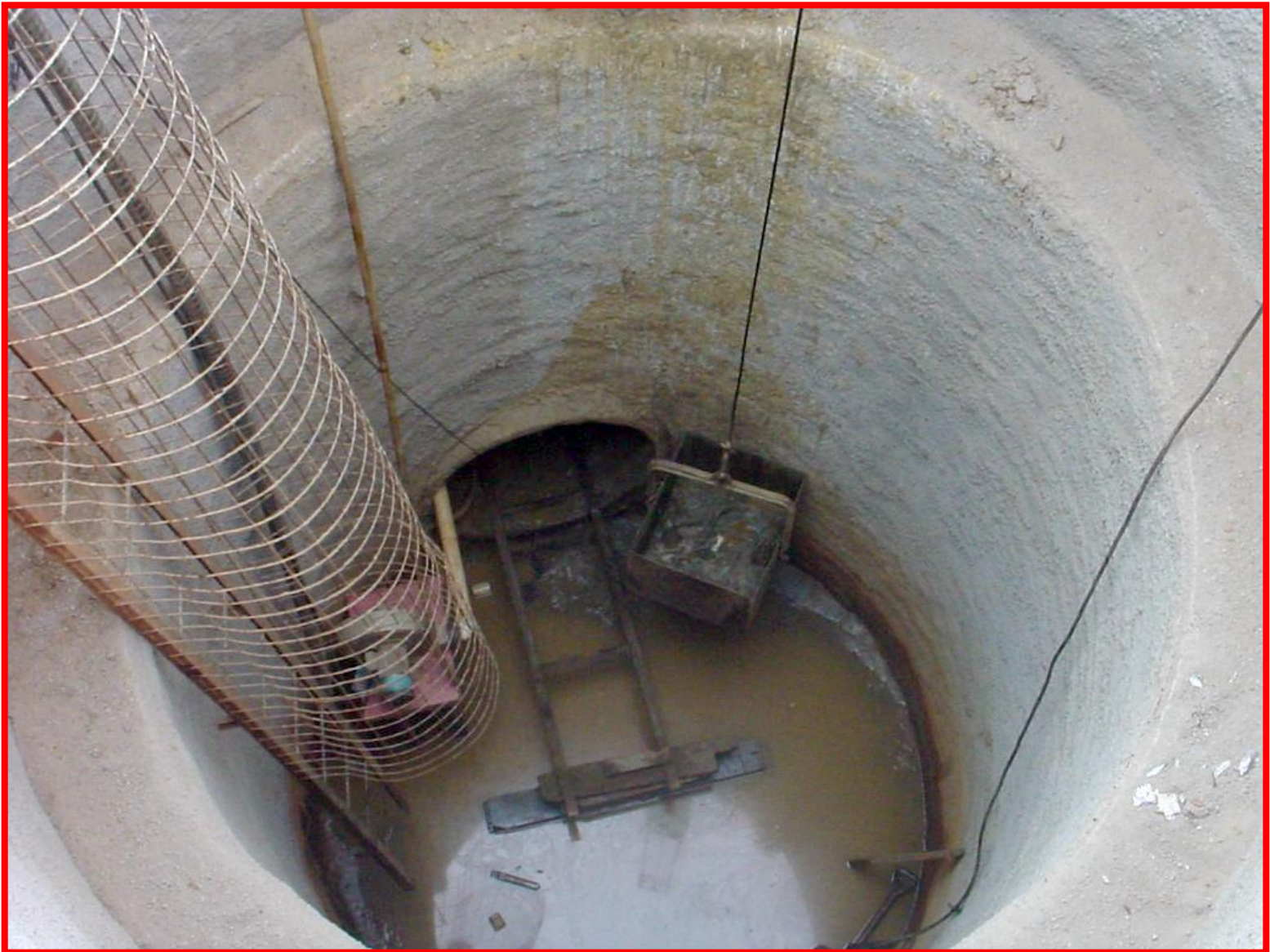
TUNNEL LINER F 1,20m, COM 23m, PARALIZADO EM 19/09/02