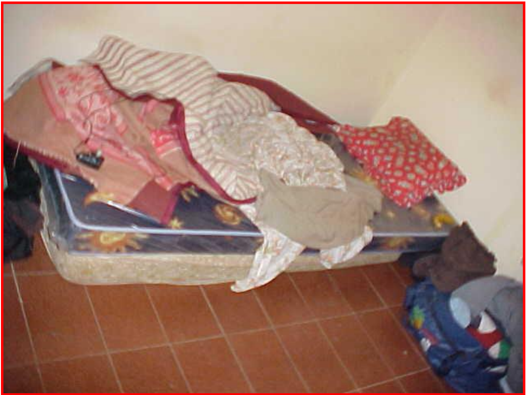
LOCAL DE DORMIR DO ENCARREGADO