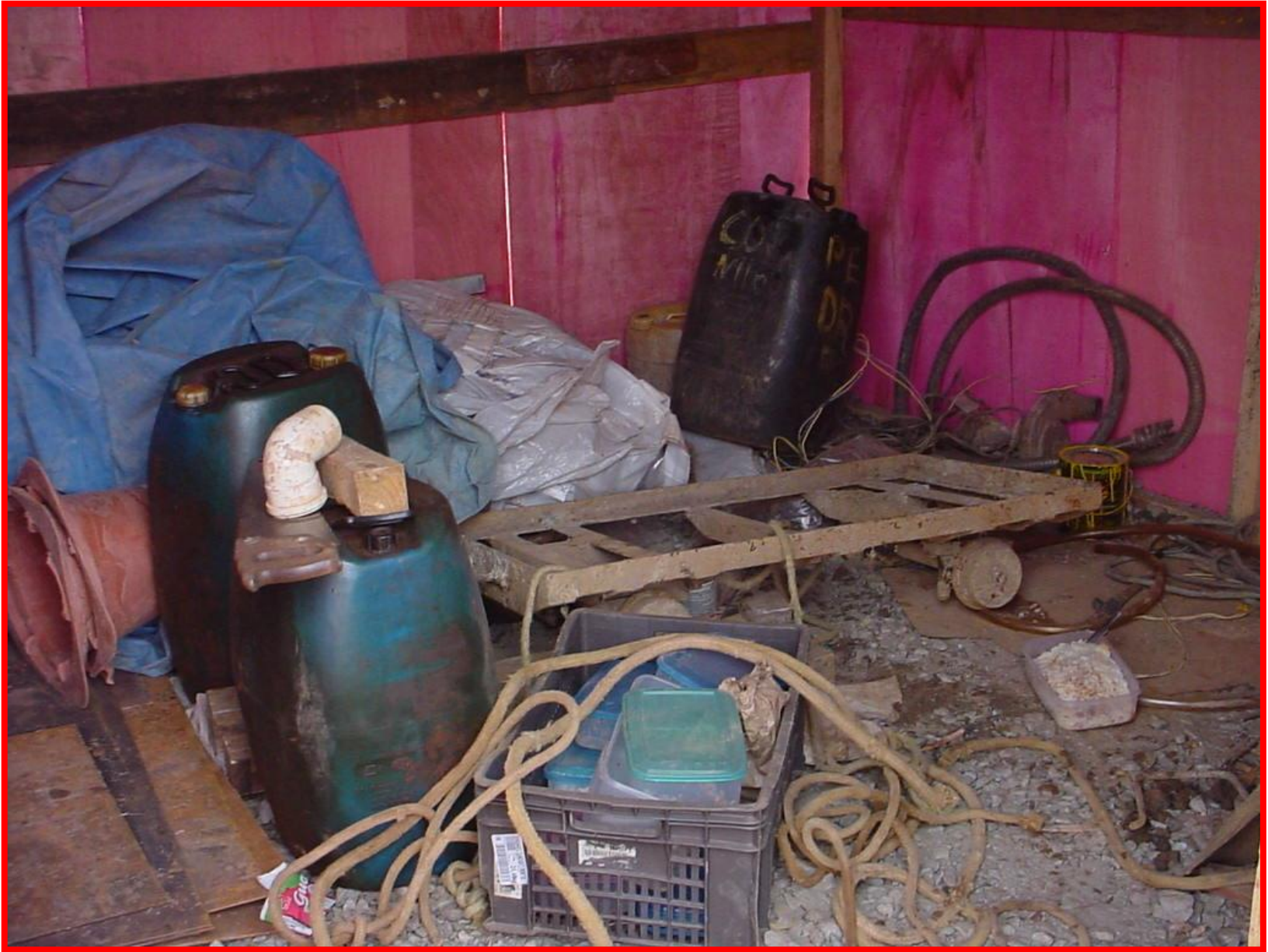
LOCAL DE REFEIÇÃO