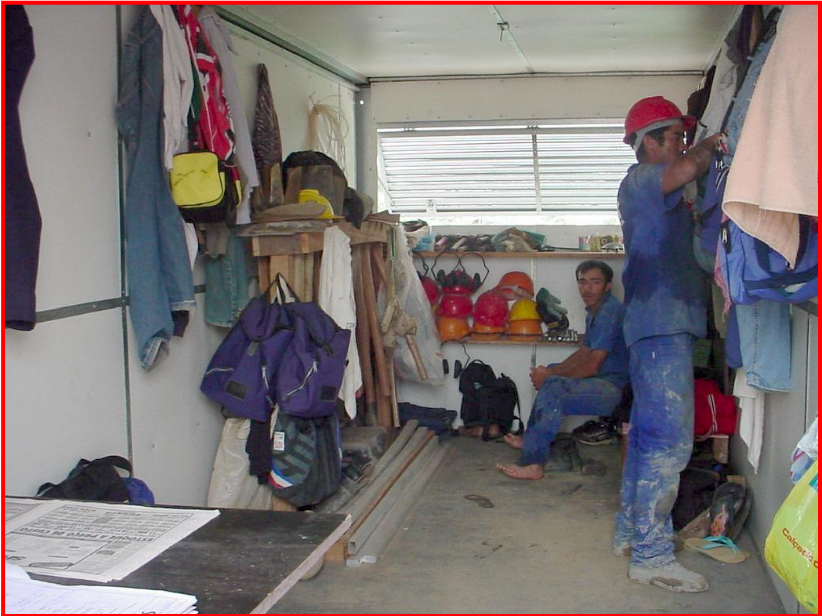
VESTIÁRIO DA SUBCONTRATADA SEM ARMÁRIOS E NA MESMA ÁREA DO ALMOXARIFADO